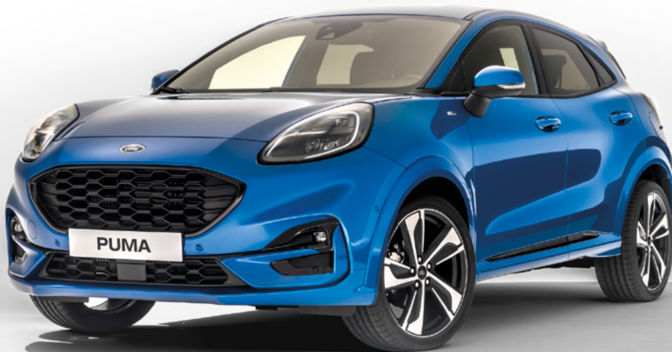
FORD PUMA ST-LINE Z LAKIEREM METALIZOWANYM DESERT ISLAND BLUE ORAZ Z WYPOSAŻENIEM OPCJONALNYM

Eksperti zdecydowali. Ford Puma, najlepiej sprzedający się model Forda w Europie, został uznany crossoverem roku 2020 wg brytyjskiego magazynu Top Gear. Ford Puma został doceniony za atrakcyjną i unikalną stylistykę, wyśmienity, wielokrotnie nagradzany silnik 1.0 EcoBoost oraz perfekcyjne prowadzenie.