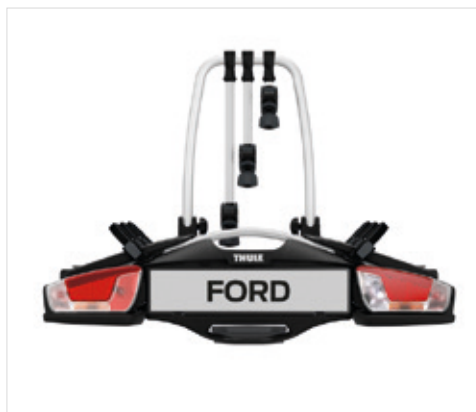
THULE® BAGAŻNIK ROWEROWY, NA 3 ROWERY, SKŁADANY I ODCHYLANY, MOCOWANY NA HAKU (2 353 444)

WSZYSTKIE WERSJE WYPOSAŻONE W HAK HOLOWNICZY | 2 558,-