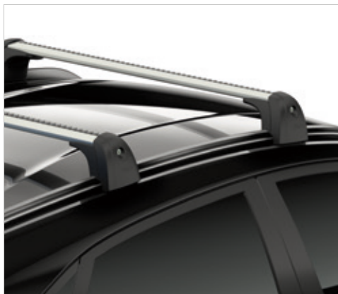
BAGAŻNIK DACHOWY (2 455 554)

WSZYSTKIE WERSJE WYPOSAŻONE W RELINGI | 1188,-