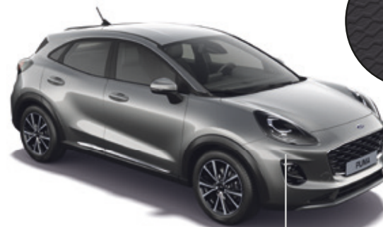
LAKIER METALIZOWANY SOLAR SILVER (OPCJA)

LEASING Z NISKĄ RATĄ FORD LEASING OPCJE 2