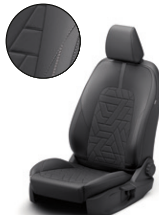
TAPICERKA MATERIAŁOWA Z MOŻLIWOŚCIĄ ZDJĘCIA I PONOWNEGO ZAŁOŻENIA TITANIUM | 1 300,-