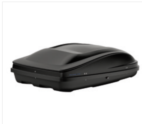
BOX DACHOWY THULE® (1 862 481)

WSZYSTKIE WERSJE WYPOSAŻONE W RELINGI | 1188,-