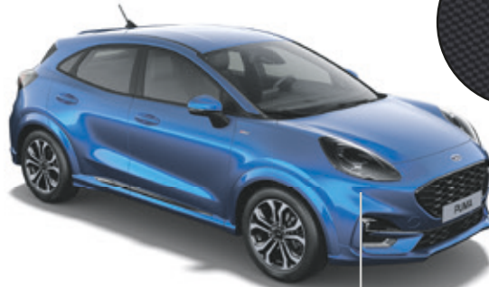
LAKIER METALIZOWANY DESERT ISLAND BLUE (OPCJA)