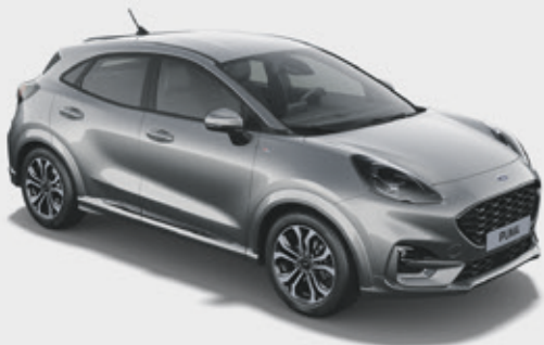
SOLAR SILVER - LAKIER METALIZOWANY

2 400,- | 1 300,- dla wersji ST-LINE Vignale