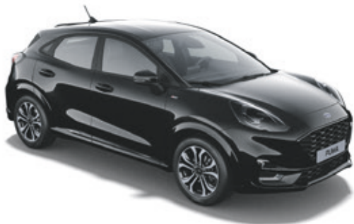
AGATE BLACK - LAKIER METALIZOWANY

Bez dopłaty | niedostępny dla wersji ST-LINE Vignale