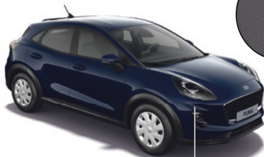
LAKIER ZWYKŁY BLAZER BLUE (BEZ DOPŁATY)