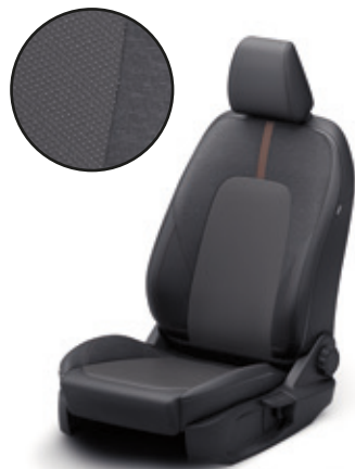
TAPICERKA MATERIAŁOWA TREND | Standard