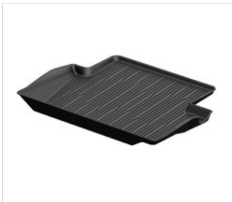
DYWANIKI PODŁOGOWE - TYŁ (2 109 989)