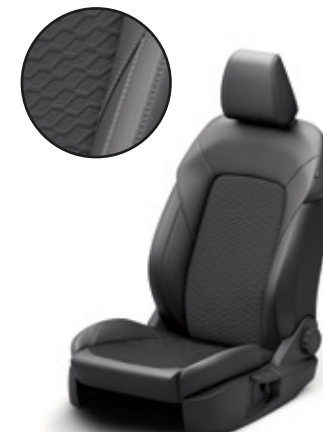
TAPICERKA CZĘŚCIOWO SKÓRZANA (SKÓRA EKOLOGICZNA) TITANIUM Z PAKIETEM X | Standard