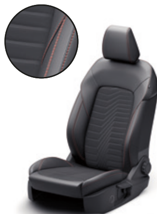
TAPICERKA CZĘŚCIOWO SKÓRZANA (SKÓRA EKOLOGICZNA) Z CZERWONYMI AKCENTAMI ST-LINE Z PAKIETEM X | Standard