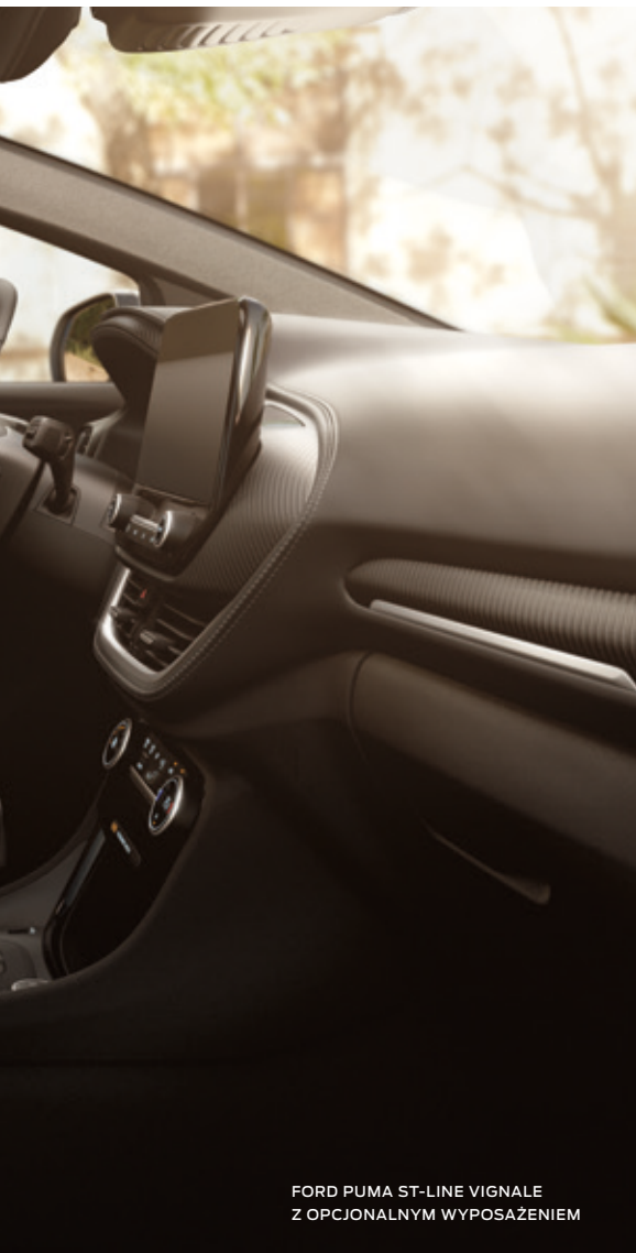
FORD PUMA ST-LINE VIGNALE Z OPCJONALNYM WYPOSAŻENIEM

Ford Puma zawdzięcza swoją popularność między innymi modnemu nadwoziu SUV, które jest obecnie najchętniej wybierane przez klientów i według ekspertów z każdym kolejnym rokiem będzie zyskiwało na popularności. Dzięki temu masz pewność, że Twoja Puma będzie modna przez długie lata. Puma jest nie tylko modna ale także ekologiczna. Jest wyposażona w niezawodne, ciche i oszczędne silniki EcoBoost Hybrid. Szczególnie warta uwagi jest wersja z automatyczną skrzynią PowerShift, która dzięki aksamitnej i płynnej zmianie biegów będzie Twoim najlepszym wsparciem w każdej podróży.