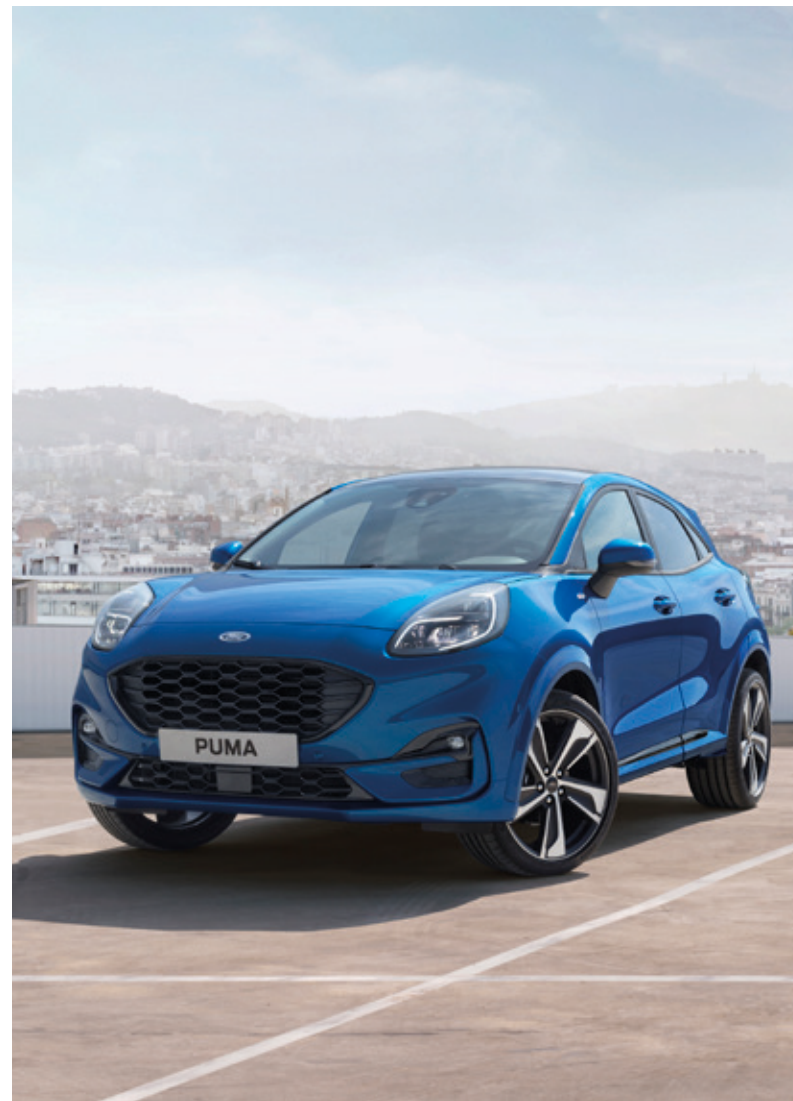
FORD PUMA ST-LINE Z PAKIETM X ORAZ Z LAKIEREM METALIZOWANYM DESERT ISLAND BLUE (OPCJA)