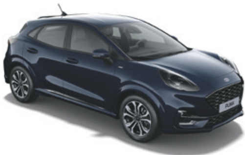
BLAZER BLUE - LAKIER ZWYKŁY

Bez dopłaty | niedostępny dla wersji ST-LINE Vignale