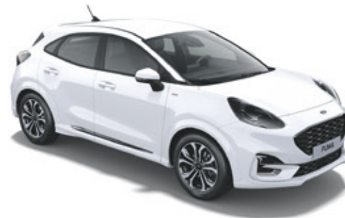
FROZEN WHITE - LAKIER ZWYKŁY

2 400,- | 1 300,- dla wersji ST-LINE Vignale