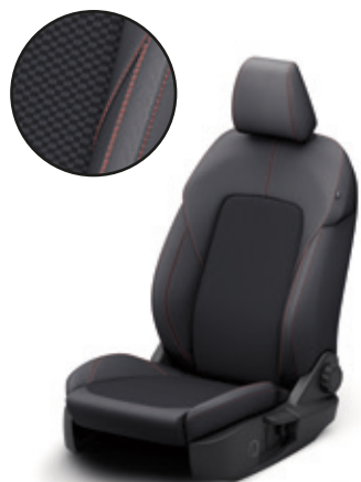
TAPICERKA MATERIAŁOWA Z CZERWONYMI AKCENTAMI ST-LINE | Standard