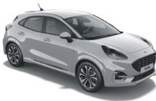
GREY MATTER - LAKIER SPECJALNY 5 000,- | niedostępny dla wersji Trend