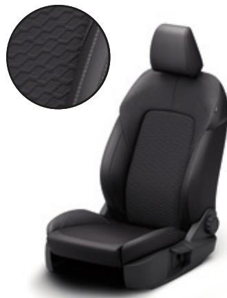
TAPICERKA MATERIAŁOWA TITANIUM | Standard