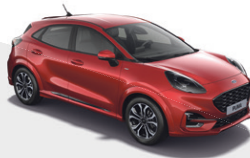
FANTASTIC RED - LAKIER METALIZOWANY SPECJALNY

3 050,- | 1 950,- dla wersji ST-LINE Vignale