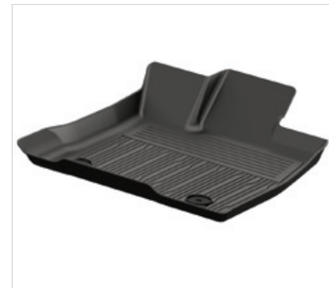
DYWANIKI PODŁOGOWE - PRZÓD, 2 SZT. (2 439 078)

WSZYSTKIE WERSJE WYPOSAŻONE W BAGAŻNIK DACHOWY | 1709,-