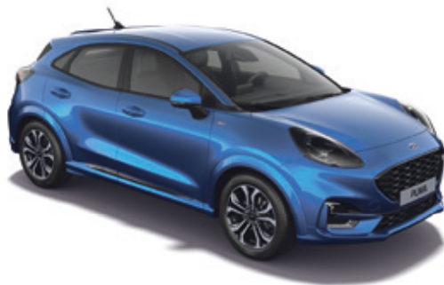
DESERT ISLAND BLUE - LAKIER METALIZOWANY 3 050,- | 1 950,- dla wersji ST-LINE Vignale | niedostępny dla wersji Trend