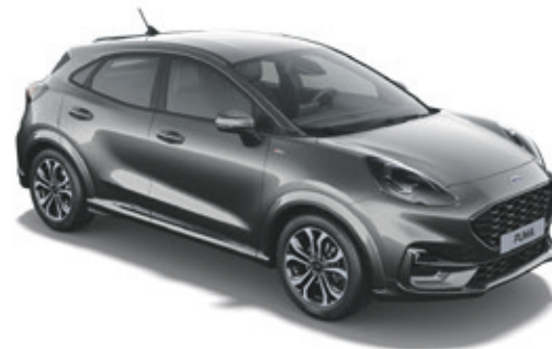
MAGNETIC GREY - LAKIER METALIZOWANY

1 100,- | bez dopłaty dla wersji ST-LINE Vignale