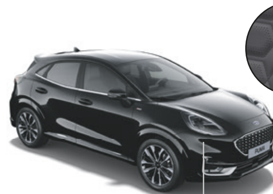
LAKIER METALIZOWANY AGATE BLACK (OPCJA)

LEASING Z NISKĄ RATĄ FORD LEASING OPCJE 2