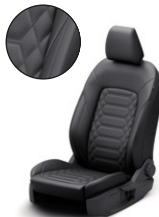
TAPICERKA SKÓRZANA ST-LINE VIGNALE | Standard